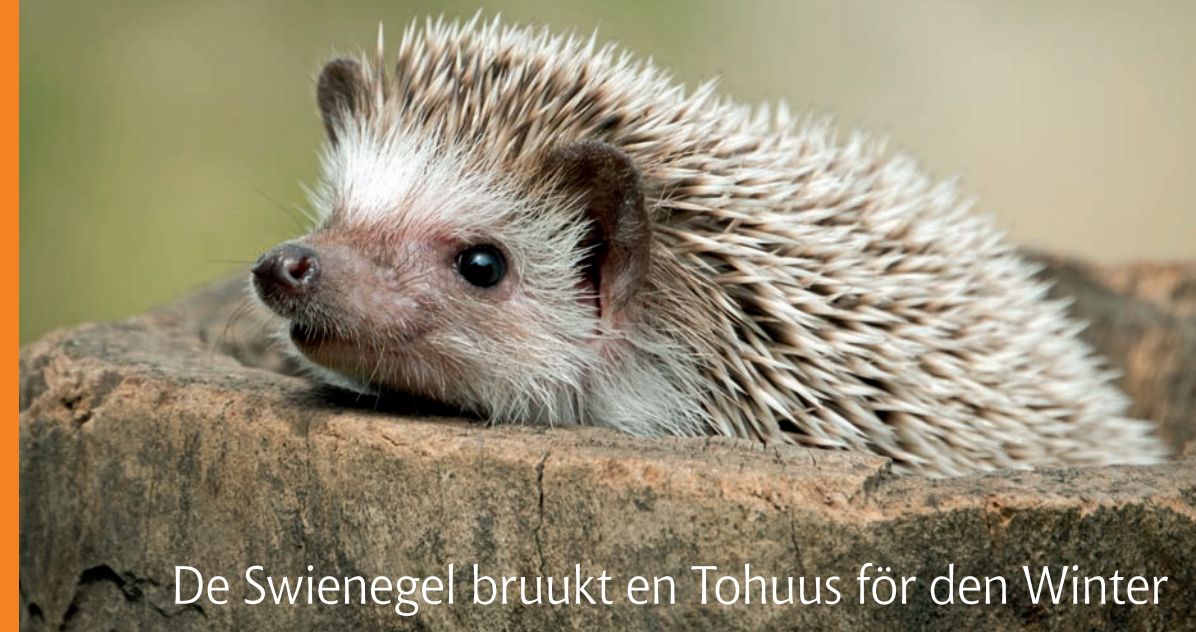
De Swienegel bruukt en Tohuus för den Winter

Un du, hest du al mal en lierlütt Wörtelkind drapen, dat sik in de Blääd versteekt?